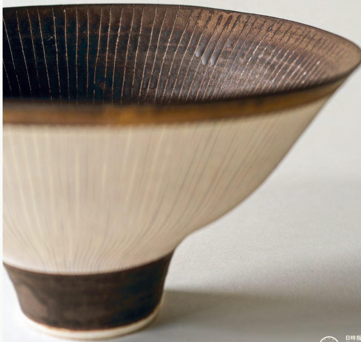
ルーシー・リー 《マンガン釉線文鉢》1970年頃 井内コレクション(国立工芸館寄託)

年間協賛 | 戸田建設株式会社、ブルームバーグ Bloomberg Van Cleef & Arpels