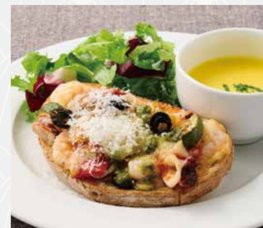
魚介とトマトのプロヴァンス風 タルティーヌセット Seafood & Tomato Provençal Tartine Set