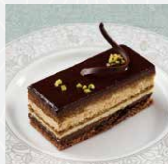
ガトーオペラ 〈ショコラガナッシュ〉 Opera