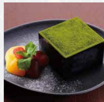
TEIENティラミス Matcha tiramisù

杏子の鮮烈な甘酸っぱさと チョコレートのココ、ヘーゼ ルナッツやアーモンドの風味 がお楽しみ頂けます。