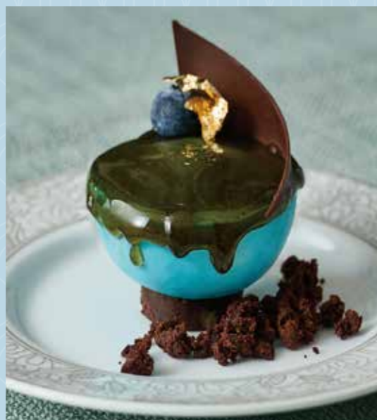
マンゴーとプラリネムースを包んだ ブルーマスカルポーネ ～ルーシー・リー〈青柚鉢〉へのオマージュ～

Blue mascarpone bowl filled with mango and praline mousse