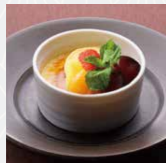
和三盆 クレームブリュレ Crème brûlée

ほろ苦い抹茶と、コクのある マスカルポーネチーズの 相性が抜群の、大人の スイーツ。表面を覆う抹茶 で庭園の芝生をイメージ しました。