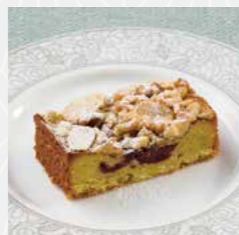
グリオットチェリーと 木の実のタルト Griotte cherry and nut tart

アーモンド香るビスキュイ や濃厚なガナッシュを コーヒークリームと交互 に重ねたフランスが誇る