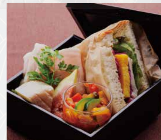
サンドイッチ“BENTO”セット Sandwich BOX