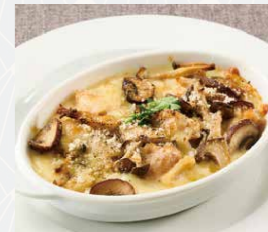
鶏と茸のグラタン Chicken & mushroom gratin with bread