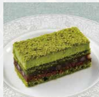
kacyo 〈抹茶ガナッシュと小豆〉 Matcha ganache and adzuki beans