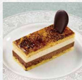
ショコラバニージュ 〈バニラムースとビターチョコ〉 Vanilla mousse and bitter chocolate