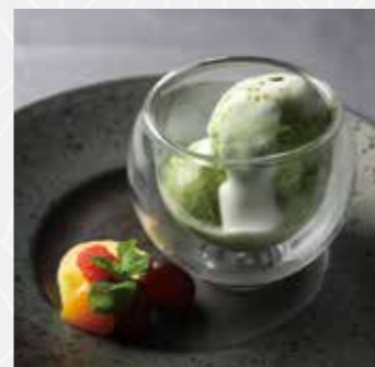
抹茶アイスの アッフォガード Matcha Affogato

カスタードの上面の砂糖を 焦がしてカラメル状にした、 普通のカスタードプディング よりもねっとり柔らかく、 濃厚な味わいのプリン。