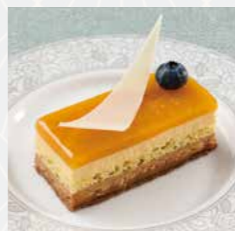
ムースアブリコット ショコラ Apricot chocolate mousse

さっくりとしたタルト生地 の中に甘酸っぱいチェリー と芳ばしい木の実を組み 合わせました。