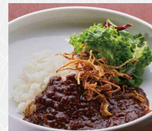
ハッシュドビーフライス Hashed beef rice