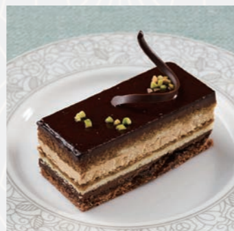
ガトーオペラ (ショコラガナッシュ) Opera

芳醇なバニラムースと濃厚 チョコレートのムースを 贅沢に重ねた2層仕立て のケーキ。