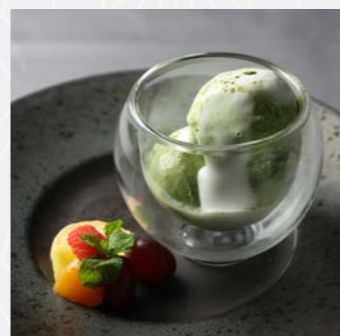
抹茶アイスの アッフォガード Matcha Affogato

カスタードの上面の砂糖を 焦がしてカラメル状にした、 普通のカスタードプディング よりもねっとり柔らかく、 濃厚な味わいのプリン。