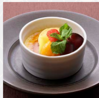
和三盆 クレームブリュレ Crème brûlée

ほろ苦い抹茶と、ココのある マスカルポーネチーズの 相性が抜群の、大人の スイーツ。表面を覆う抹茶 で庭園の芝生をイメージ しました。