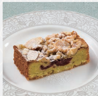
グリオットチェリーと 木の実のタルト Griotte cherry and nut tart

アーモンド香るビスキュイ や濃厚なガナッシュを コーヒークリームと交互 に重ねたフランスが誇る 古典菓子。