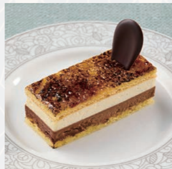
シヨコラパニーユ (バニラムースとビターチョコ) Vanilla mousse and bitter chocolate