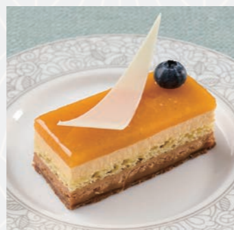
ムースアブリコット ショコラ Apricot chocolate mousse

さつくりとしたタルト生地 の中に甘酸っぱいチェリー と芳ばしい木の実を組み 合わせました。