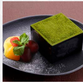
TEIENティラミス Matcha tiramisu

杏子の鮮やかな甘酸っぱさと チョコレートのココ、ヘーゼ ルナッツやアーモンドの風味 がお楽しみ頂けます。