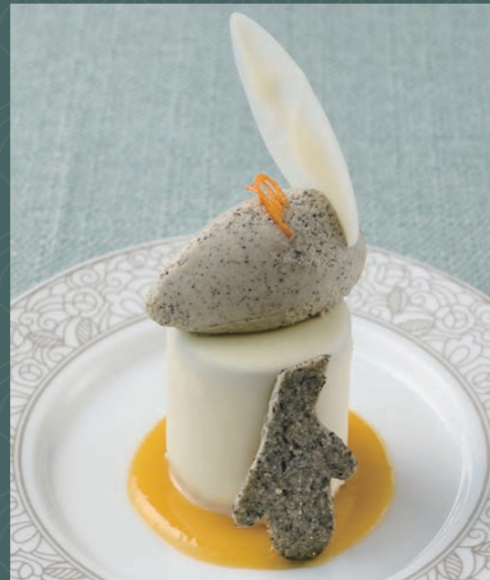
タルト・ショコラ・アマレーナ ～迷子のペンギン～ Tarte Chocolat - Amarena ～ Le Manchot Égaré ～