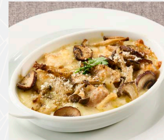
鶏と茸のグラタン Chicken & mushroom gratin with bread