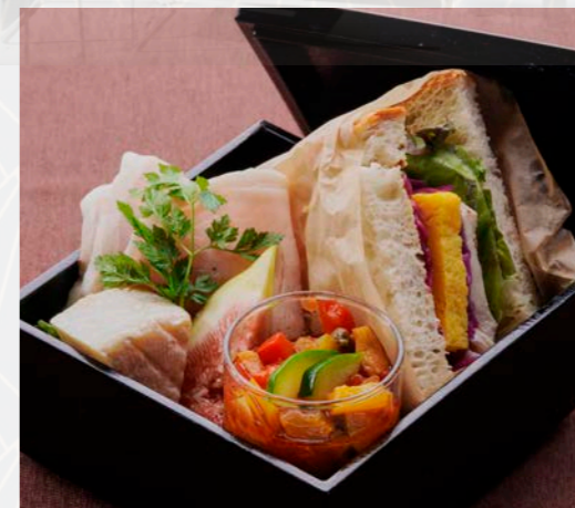
サンドイッチ“BENTO”セット Sandwich BOX