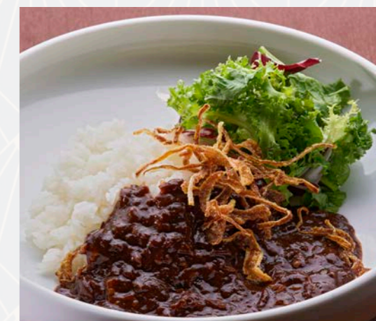
ハッシュドビーフライス Hashed beef rice