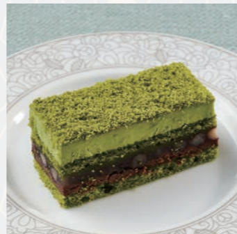
kacyo (抹茶ガナッシュと小豆) Matcha ganache and adzuki beans

フードラストオーダー 17:00 / ケーキ・ドリンク ラストオーダー 17:30 価格は全て税込み価格です。 Food last order 17:00 / cake and drink last order 17:30 All prices are tax included.