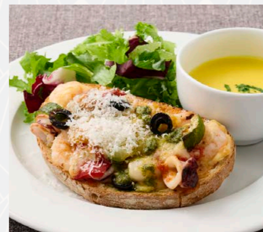
魚介とトマトのプロヴァンス風 タルティヌセット

サンドイッチ/野菜のマリネ/カマンベールチーズ ジャンボンブラン/フルーツ 仕入状況により写真と異なる場合がございます