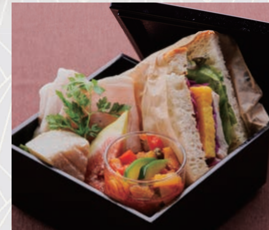
サンドイッチ“BENTO”セット Sandwich BOX