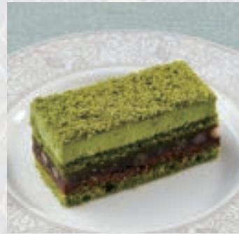
kacyo 〈抹茶ガナッシュと小豆〉 Matcha ganache and azuki beans

フードラストオーダー 17:00 / ケーキ・ドリンク ラストオーダー 17:30 価格は全て税込み価格です。 Food last order 17:00 / cake and drink last order 17:30 All prices are tax included.