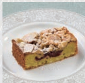
グリオットチェリーと 木の実のタルト Griotte cherry and nut tart

アーモンド香るビスキュイ や濃厚なガナッシュを コーヒークリームと交互 に重ねたフランスが誇る 古典菓子。