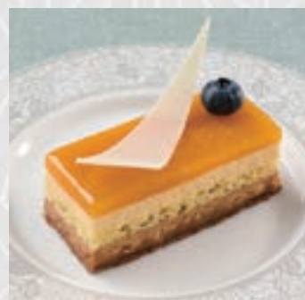
ムースアプリコット ショコラ Apricot chocolate mousse

さっくりとしたタルト生地 の中に甘酸っぱいチェリー と芳ばしい木の実を組み 合わせました。