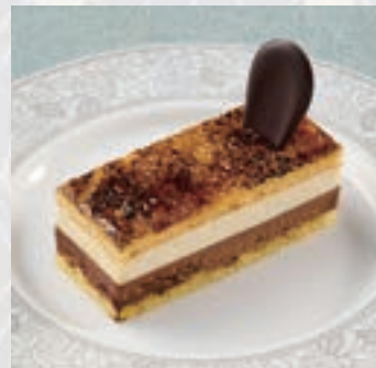
ショコラバニョウ 〈バニラムースとビターチョコ〉 Vanilla mousse and bitter chocolate