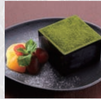
TEIENティラミス Matcha tiramisù

杏子の鮮烈な甘酸っぱさと チョコレートのココ、ヘーゼ ルナッツやアーモンドの風味 がお楽しみ頂けます。