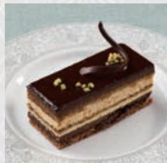
ガトーオペラ 〈ショコラガナッシュ〉 Opera

芳醇なバニラムースと濃厚 チョコレートのムースを 贅沢に重ねた2層仕立て のケーキ。