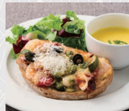
魚介とトマトのプロヴァンス風 タルティーヌセット Seafood & Tomato Provençal Tartine Set

サンドイッチ/野菜のマリネ/カマンベールチーズ ジャンボンブラン/フルーツ 仕入状況により写真と異なる場合がございます