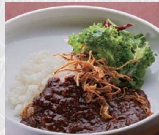
ハッシュドビーフライス Hashed beef rice