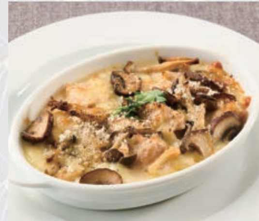
鶏と茸のグラタン Chicken & mushroom gratin with bread