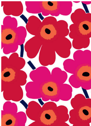
《ビエニ ウニッコ》マイヤ・イソラ 1964年 © Marimekko Oyj Suomi-Finland Maija Isola 1964

フィンランドを代表するデザインハウス、マリメッコ。1951年の創業以来、世に送りだされたプリント・デザインは3500種類以上にのぼります。鮮やかな色彩と大胆な模様によって、私たちの生活を豊かに彩るデザインは、世代や国境を超えて広く支持されてきました。本展では、様々な年代の貴重なドレスやファブリック、制作過程のイメージなど、多彩な資料を通してマリメッコの創造の美学を明らかにします。重要文化財の旧朝香宮邸。この歴史的な建築空間に広がる、マリメッコのプリントの世界を心ゆくまでお楽しみください。