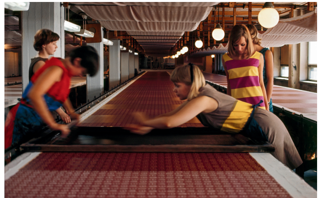
ハンドスクリーンでファブリックをプリントする様子