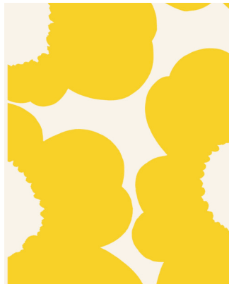
《イソ ウニッコ》マイヤ・イソラ 1964年/2023年 © Marimekko Oyj Suomi-Finland Maija Isola 1964/2023