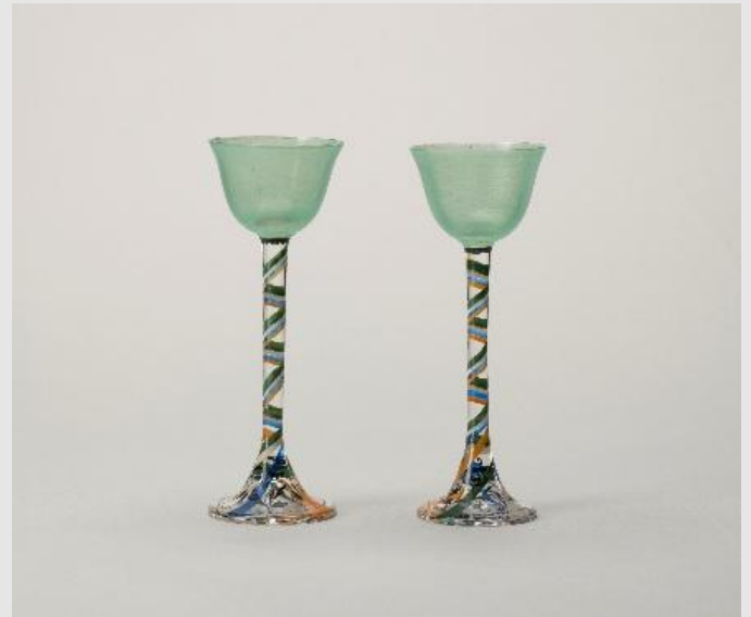
左：ルーシー・リー 《鉢》 1926年頃 個人蔵 右：上野リチ・リックス(装飾)／ヨーゼフ・ホフマン(形) 《リキュールグラス》 1929年 [1917年(形)／1929年(装飾)] 京都国立近代美術館蔵