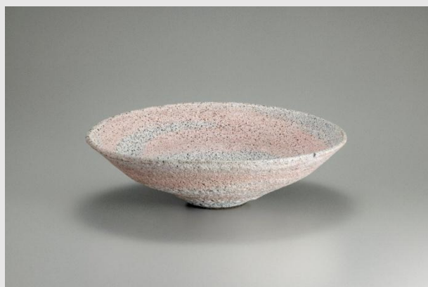
ルーシー・リー 《熔岩釉鉢》1980年頃 井内コレクション（国立工芸館寄託）

東京都庭園美術館の本館は、1933年に朝香宮家の自邸として竣工したアール・デコ建築です。うつわ本来の魅力を引き出す邸宅空間で、ルーシー・リーの繊細かつ優美な造形世界と、旧朝香宮邸の建築との対話をお楽しみください。