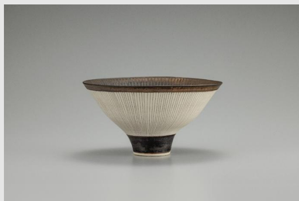
ルーシー・リー 《マンガン釉線文鉢》1970年頃 井内コレクション（国立工芸館寄託）