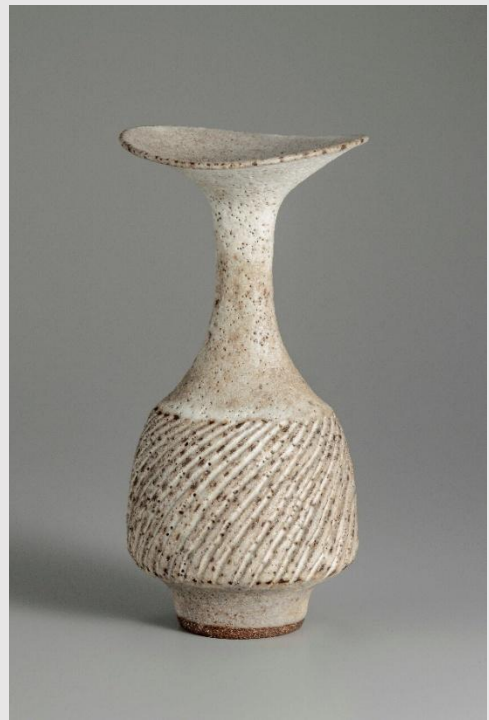
左：濱田庄司《塩釉鉄砂抜絵注瓶》1965-70年頃 国立工芸館蔵 撮影：下瀬信雄 ©株式会社濱田窯 右：ルーシー・リー《白釉鎬文花瓶》1976年頃 国立工芸館蔵 撮影：品野 壘