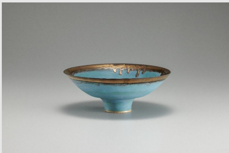
ルーシー・リー 《青釉鉢》 1980年頃 井内コレクション（国立工芸館寄託）

本展では、ウィーンで出会ったヨーゼフ・ホフマンや、ロンドン時代に知り合ったバーナード・リーチ、ハンス・コパーなど、リーと交流のあった作家たちの作品をあわせて展示し、日本を中心とした東洋のやきものとの関係性も見直します。制作初期から円熟期まで、リーが出会った場所、人、もの、時代背景を交えながら作品を紐解くことで、その造形の源泉や作品に表された信念に迫ります。