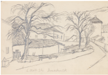
《外遊スケッチ》1932-33(昭和7-8)年 鉛筆、紙 夢二郷土美術館蔵