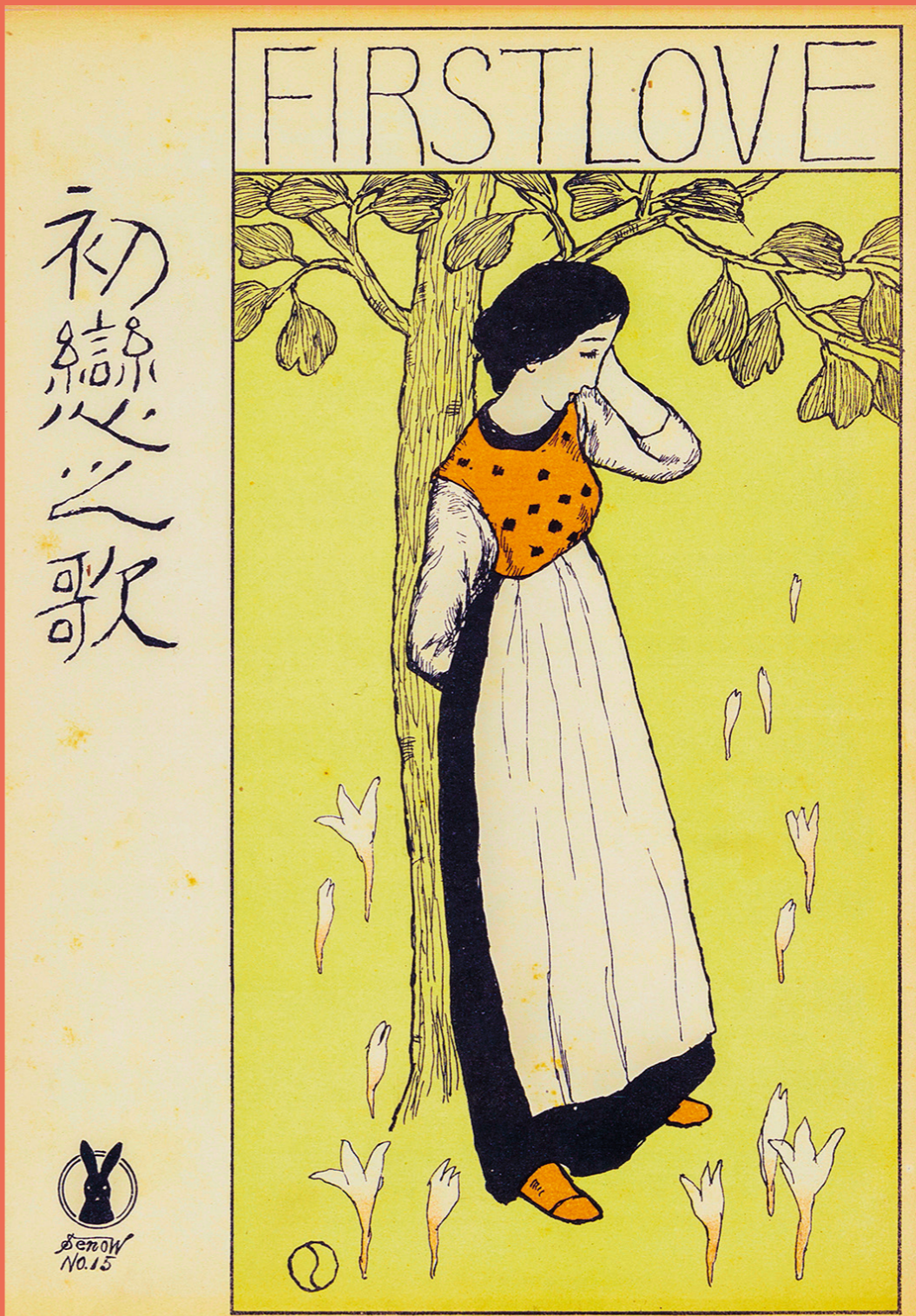
(セノオ英繪(初戀心之歌))1918(大正7)年3版 / 1916(大正5)年初版 夢二郷土美術館蔵

開館時間：10時～18時（入館は閉館の30分前まで） 休館日：毎週月曜日 *ただし7月15日(月祝)、8月12日(月祝)は開館、7月16日(火)、8月13日(火)は休館 主催：公益財団法人東京都歴史文化財団 東京都庭園美術館 産経新聞社 監修：藤田昌幸 東京大学名誉教授 藤原正元 元美術館特別顧問 特別協力：夢二郷土美術館 協力：竹久夢二学会 協賛：良東日本 年間運営：戸田建設株式会社、アムステルダム