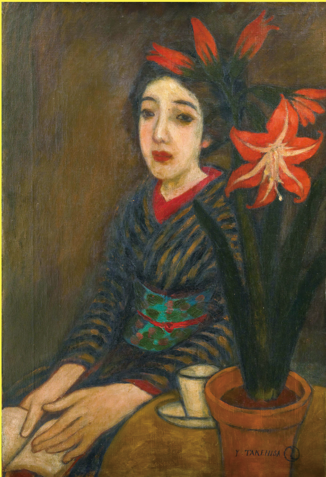
(アマリス)1919(大正8)年頃 油彩、カンヴァス 夢二郷土美術館蔵

開館時間：10時～18時（入館は閉館の30分前まで） 休館日：毎週月曜日 *ただし7月15日(月祝)、8月12日(月祝)は開館、7月16日(火)、8月13日(火)は休館 主催：公益財団法人東京都歴史文化財団 東京都庭園美術館 産経新聞社 監修：藤田昌幸 東京大学名誉教授 藤原正元 元美術館特別顧問 特別協力：夢二郷土美術館 協力：竹久夢二学会 協賛：良東日本 年間運営：戸田建設株式会社、アムステルダム