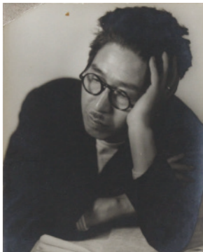
宮武東洋「竹久夢二ポートレート」 夢二郷土美術館蔵