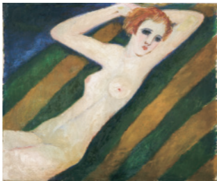
《西海岸の裸婦》1931-32(昭和6-7)年 油彩、カンヴァス 夢二郷土美術館蔵