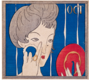
《化粧の秋(「婦人グラフ」表紙絵)》1924(大正13)年 木版 夢二郷土美術館蔵