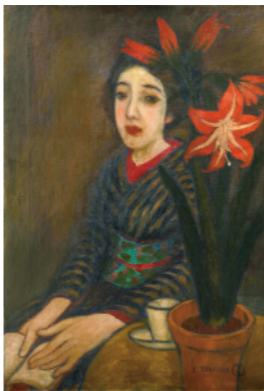
《アマリス》1919(大正8)年頃 油彩、カンヴァス 夢二郷土美術館蔵

長らく所在不明であった油彩画《アマリス》が、近年の調査により発見されました。夢二の油彩画は現存するだけでも約30点と少なく、本作はその来歴も含めて大変貴重な作例といえます。本展は発見後、東京で公開・展示する初めての機会となります。また《アマリス》に加えて、貴重な油彩画を多数展示し、これまであまり紹介されてこなかった油彩画家としての夢二の一面に迫ります。