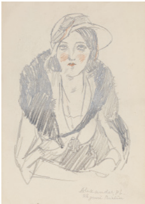
《外遊スケッチ》1932-33(昭和7-8)年 鉛筆・色鉛筆、紙 夢二郷土美術館蔵

夢二は、晩年の1931(昭和6)年から約2年間、欧米各地を巡る旅に出かけます。1930年代前半は、モダンな芸術と都市文化が急速に発展する一方で、ナチズムが勃興する不穏な時代でもありました。夢二は欧米滞在中の出来事を多数のスケッチとして残し、その一部は友人の手元に残されました。本展では初公開となるスケッチ帖を紹介いたします。