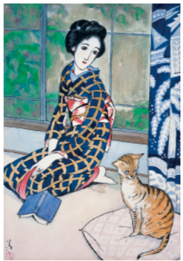
《晩春》1926(大正15)年 鉛筆・ペン・水彩、紙 夢二郷土美術館蔵