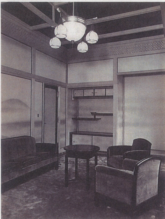
図1.1階喫煙室(昭和8年竣工時)昭和58年開館に際し全面改修し、現在は展示室として使用。

女主人である允子妃殿下 のぶこ が薨去されたのち、朝香宮家のご家族団欒の機会は極めて少なくなりました。第1王子 ごうきよ 孚彦王は歩兵第1連隊に所属し、ついで千葉に家を借りて歩兵学校に勤務、第2王子正彦王も海軍兵学校卒業後、艦隊勤務となり、白金台の邸宅には時々しか戻られませんでした。やがて二人の王子はご結婚し独立されました。鳩彦殿下とお二人の暮らしとなった きよこ 漑子女王のご生活は、女子学習院本科ご卒業後、ピアノ、フランス語、油絵、活け花、茶の湯のほか、編物・洋裁・料理に習字・和歌など、1週間を通してお稽古事があり、お休みは土日のみでした。お稽古事は接客部分であった「1階喫煙室」を使用されていました*1。陸軍中將及び近衛師団長の鳩彦殿下は師団の運転手付きの車で朝出勤し、夕方帰るとい