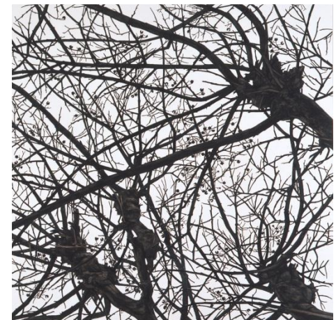
《空との距離VI》2008,Pigment on paper,240×240cm ©Rieko Hidaka